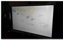
Integración del Panel Digital en el alumnado.