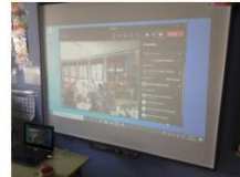
Conexiones entre alumnos de diferentes localidades.