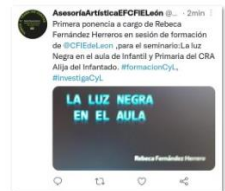
Evidencias Comunicación Externa.