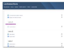
Uso de Aulas Virtuales en Infantil