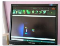
Formación del profesorado por Teams. Curso Luz Negra en el Aula.